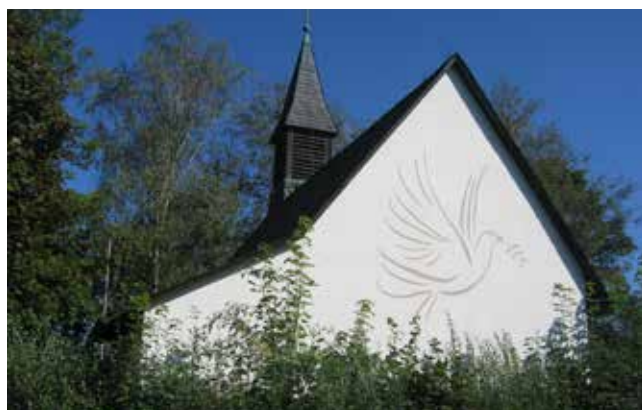
Seit der Renovierung 2024 schmückt eine Friedenstaube die Rückseite der Christ-König-Kapelle in Triebenreuth. Ein Signal aus Triebenreuth an die Welt.

So erhielt Triebenreuth im Jahre 1978 beim Wettbewerb „Das schönere Dorf“ den 1. Preis, ein Jahr später den 2. Preis. In den Jahren 2013 und 2016 wurde man jeweils mit dem ersten Preis beim Wettbewerb „Unser Dorf hat Zukunft“ prämiert. Das herausragende Engagement der Triebenreuther ist überall spürbar und in besonderer Weise sichtbar in der Erhaltung ihrer Christ-König-Kapelle. Wenn nun am 3. Sonntag im Oktober die Triebenreuther Kirchweih gefeiert wird, haben die Bewohner des kleinen Frankenwalddörfchens ihre Kapelle herrlich herausgeputzt. Wie immer mit Eigeninitiative, mit Eigenmitteln und viel Ausdauer und Zusammenhalt. Diese Dorfgemeinschaft ist wahrscheinlich einmalig und man hofft, dass dies noch lange anhält.