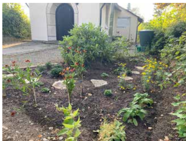
Nach der Renovierung funkelt die gesamte Christ-König-Kapelle in Triebenreuth wie neu. Auch eine Neubepflanzung im Außenbereich signalisiert, dass da schicke Kirchenhaus bereit ist für die kommenden Jahre.