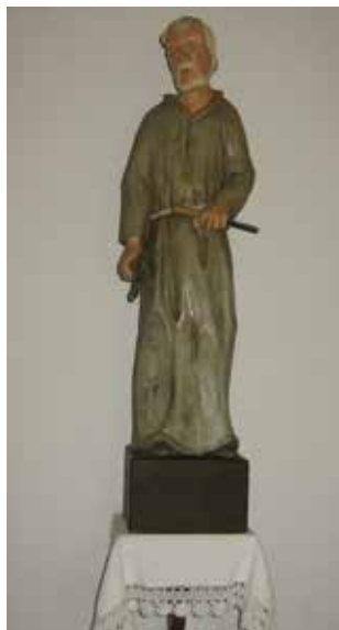
Auf der rechten Seite neben dem Altar befindet sich die Himmelskönigin Maria mit Krone und dem Jesuskind. Ebenfalls auf der rechten Seite neben dem Altar steht der Heilige Josef mit den Insignien des Zimmermannes.

Im Jahre 1984 wurde die Christ-König-Kapelle neu verputzt und innen neu gestaltet. Stolz schmückt auch das Bild der Kapelle die Fahne der örtlichen Feuerwehr.