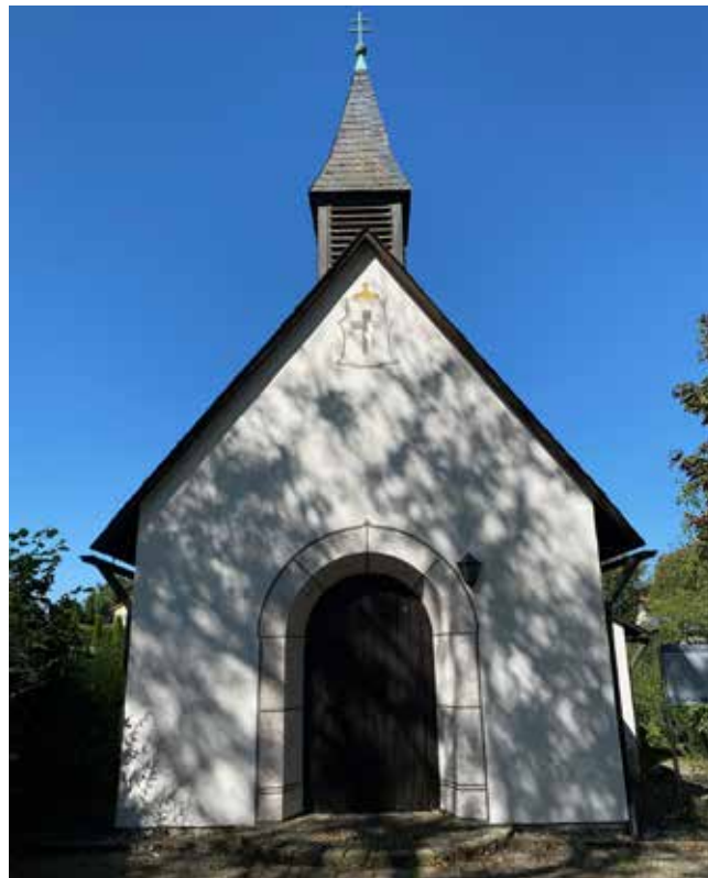
Die Christ-König-Kapelle in Triebenreuth heute.