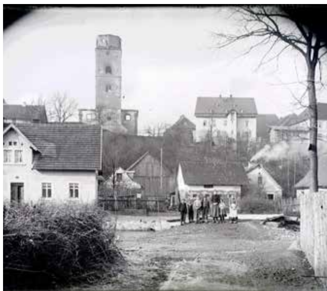
Die Rokoko-Kirche aus dem Jahre 1776 brannte 1903 ab. Hier eine „Fotographie“ kurz nach dem Brand der 127 Jahre alten Kirche. Damals war der Kirchturm nach Osten gerichtet in Richtung der aufgehenden Sonne. Die Ansicht der abgebrannten Kirche von der Seite der Wehrstraße..