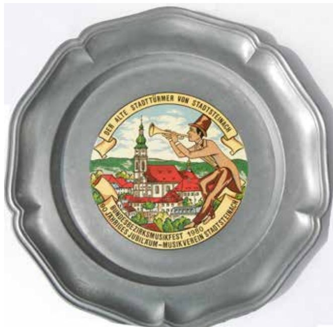
Der Musikverein Stadtsteinach würdigte anlässlich seines 100-jährigen Bestehens im Jahre 1990 die Stadttürmer von Stadtsteinach mit einem herrlichen Logo, das auch auf einem Zinnteller abgebildet war.