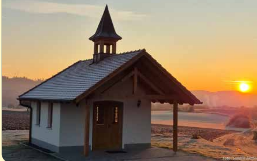
Sonnenaufgang an der Dorfkapelle in Poppenholz