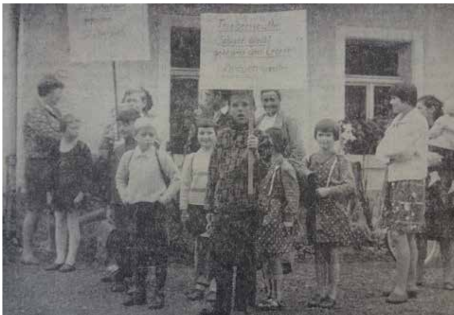
Die Schüler und deren Eltern boykottierten zum Schulanfang 1967/68 die Schließung „ihrer“ Schule und weigerten sich, in den Bus einzusteigen.